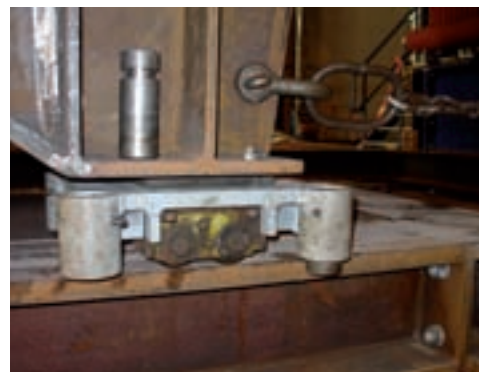
Traditionel "rulleskøjte" med flytbare sidestyk.