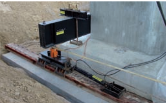
Skubbesystem. Bakseskinner med aflange huller, hvor fæstet for den hydrauliske cylinder kan skubbe fra.