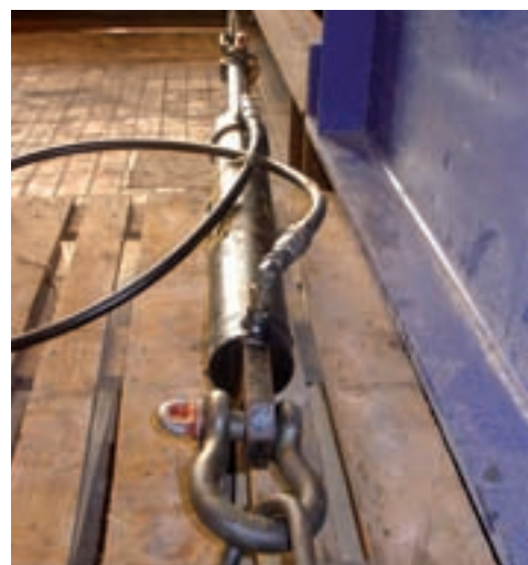
Hydraulisk trækcyliner, der giver stor præcision og styrke.

Holstebro Gjetttrupvej 2 · DK-7500 Holstebro Tel.: +45 97 42 45 00 Fax: +45 97 41 30 05 www.krangarden.dk