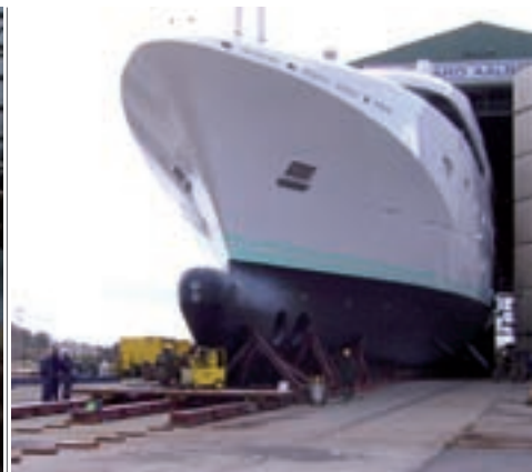
1600 ton yacht skiddes ud på tre bakseskinnebaner i Aalborg.